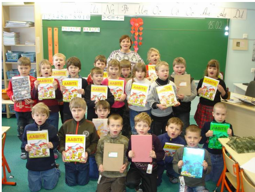
Piltmõistatus: leia 2006. aasta aabitsapeo pildilt üles selle kevade koolilõpetajad.