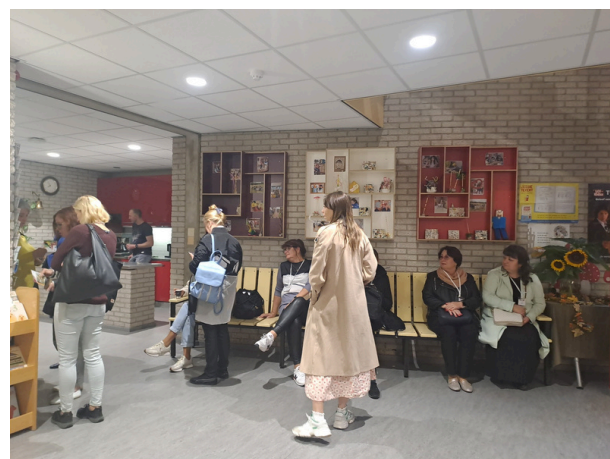
FOTOD: VAIDA KOOLI ÕPETAJAD