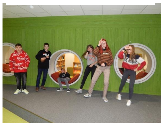
Õpilased katsetamas vabalava.