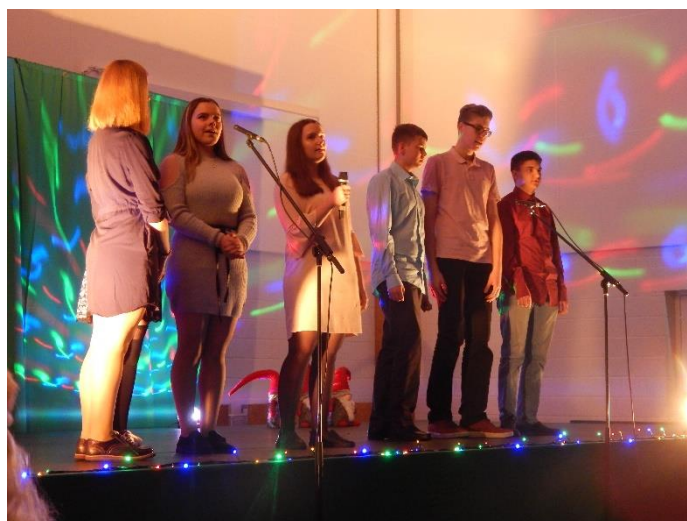
9.klassi esitus- laulavad laulu „Jõulukellad“.