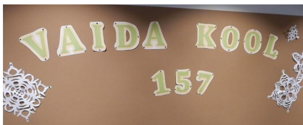
Aastal 2019 täitus Vaida koolil 157 aastat.

17.01 - vabalava etteasted (luuletused, laulud, head naljad) lavaga puhkesaalis.