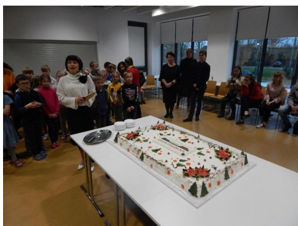
Sünnipäevatordi pidulik lahti lõikamine söögisaalis.